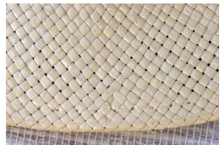
Détail du tressage de la fibre