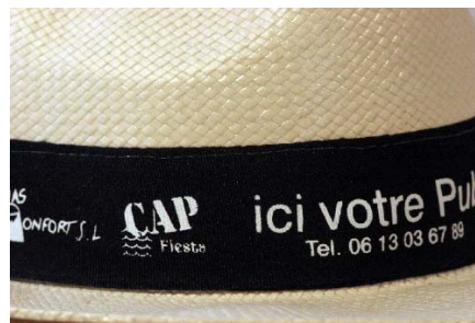
Bandeau large, visibilité accrue